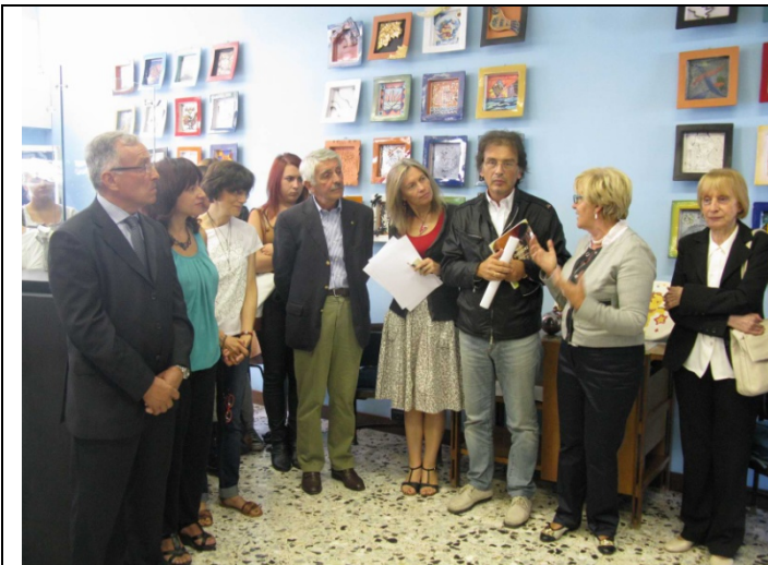
Momento della premiazione borsa di studio Aldo Moretto