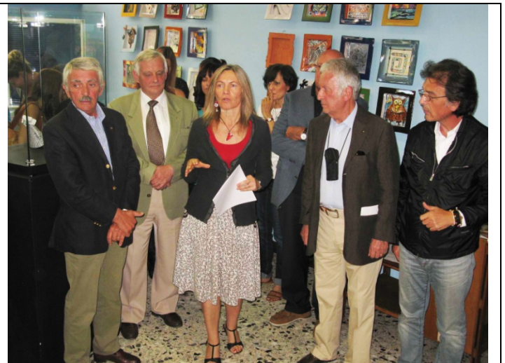
Presentazione progetto Borse di studio Rotary